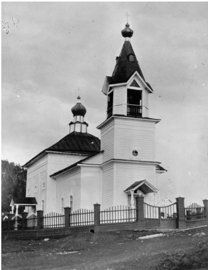
Церковь Рождества Пресвятой Богородицы в Кандалакше. Фото начала XX века