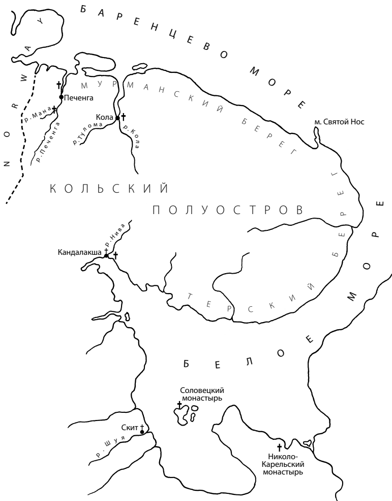
Места просветительской деятельности преподобных Феодорита и Трифона