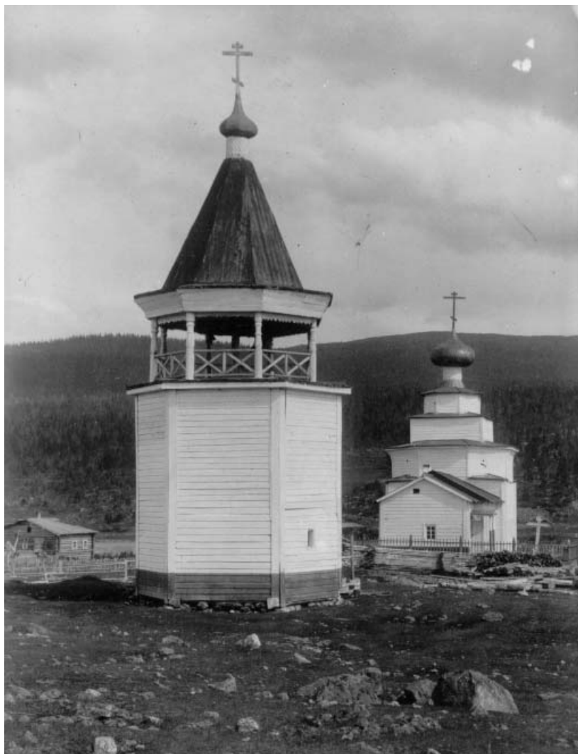
Церковь Рождества Иоанна Предтечи в Кандалакше. Фото начала XX века